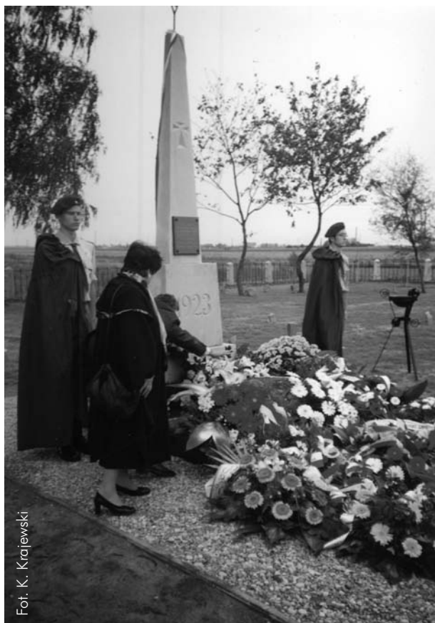
Cmentarz petlurowców w Szczypiornie