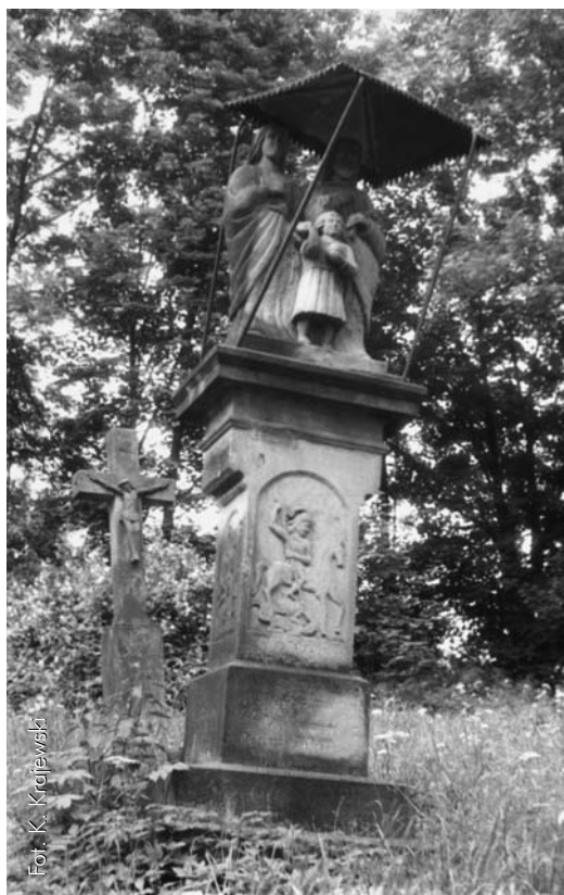
Nagrobki na opuszczonym cmentarzu łemkowskim

RP a Rządem Ukrainy o ochronie miejsc pamięci i spoczynku ofiar wojen i represji politycznych. Ze strony polskiej do prowadzenia tego rodzaju spraw desygnowana została Rada Ochrony Pamięci Walk i Męczeństwa. Strona ukraińska po upływie kolejnych czterech lat, w 1998 r., wyznaczyła osobę upoważnioną i odpowiedzialną za realizację umowy dwustronnej „o ochronie miejsc pamięci i spoczynku ofiar wojen i represji”, kierującą bieżącą polityką Ukrainy w tej ważnej płaszczyźnie wzajemnych stosunków obu państw. Funkcję tę pełnił minister Wołodymyr Husakow, który przewodniczył Państwowej Międzyresortowej Komisji ds. Upamiętniania Ofiar Wojny i Represji Politycznych działającej przy rządzie Ukrainy. Decyzja ta otworzyła nowy rozdział we wzajemnych stosunkach w zakresie odnoszącym się do sfery szeroko rozumianej pamięci narodowej. Efektem współpracy Rady OPWiM z ukraińską Międzyresortową Komisją był podpisany w marcu 1999 r. protokół, który omawiał kwestie techniczne związane z porządkowaniem grobów i cmentarzy wojennych – polskich na Ukrainie i ukraińskich w Polsce.