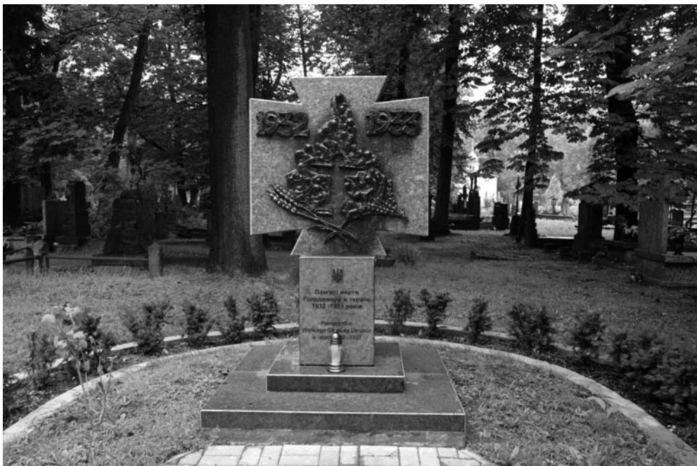
Współczesny pomnik „Pamięci Ofiar Wielkiego Głodu na Ukrainie w latach 1932–1933”, wzniesiony na cmentarzu prawosławnym na warszawskiej Woli