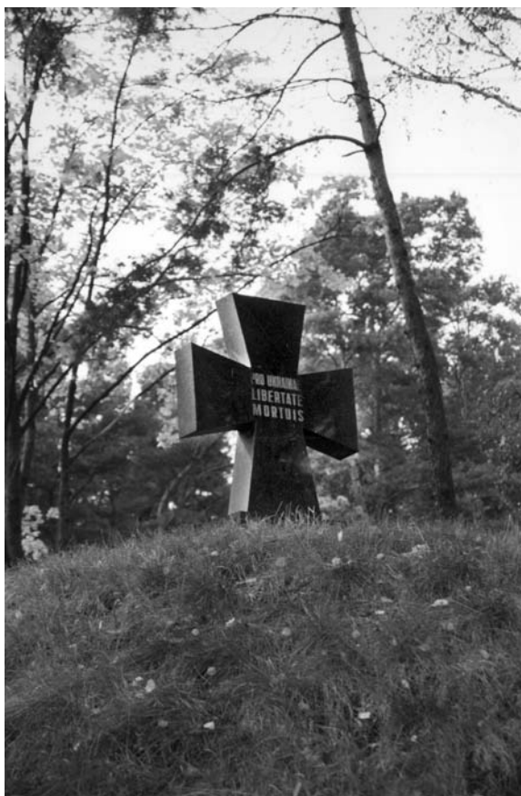
Cmentarz petlurowców w Aleksandrowie Kujawskim